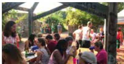
Ambiance festive aux anciennes Cartoucheries.

La Courrouze, entre espace naturel et espace culturel, est le lieu idéal pour se détendre, s'activer ou s'aérer. Les chemins piétons et les voies cyclables permettent de rejoindre facilement les nombreux lieux culturels. Qu'il s'agisse d'anciennes constructions industrielles habilement rénovées, comme les Cartoucheries, ou d'aménagements modernes, le quartier offre une multitude de possibilités et d'activités pour tous les âges. Les espaces publics sont également propices à de nombreuses interactions entre habitants, avec des rendez-vous et des projets conviviaux tels que les pique-niques festifs ou les jardinières partagées.