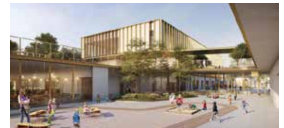
Pôle éducatif Simone Veil (ouverture septembre 2023) : crèche, école maternelle, école primaire.