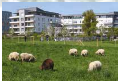
Dans le quartier, l'écopâturage.