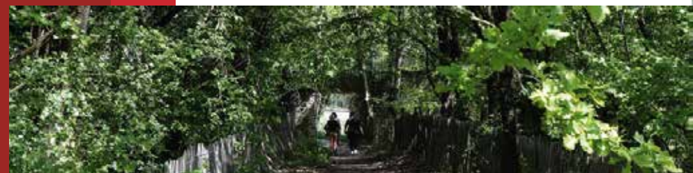
De beaux sentiers pour privilégier les liaisons douces

Petite ville au cœur de la ville, la Courrouze se distingue par son caractère naturellement éco-responsable à seulement 10 min du centre-ville.